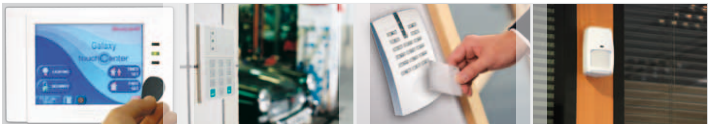
Galaxy® Dimension TouchCenter

Periferiche di prima categoria basate sulle tecnologie più avanzate